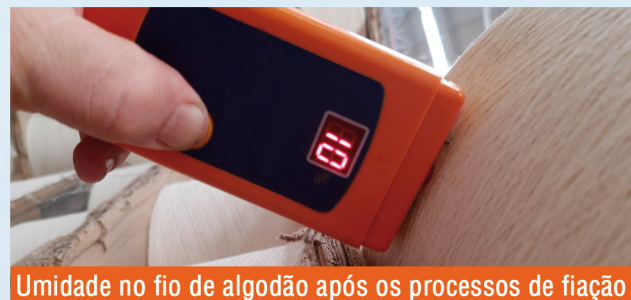
Umidade no fio de algodão após os processos de fiação