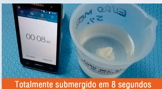
Totalmente submerso em 8 segundos