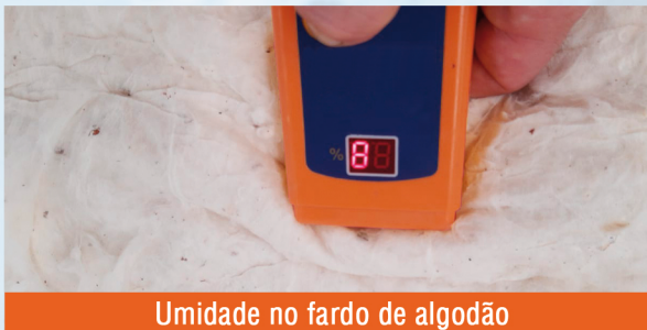
Umidade no fardo de algodão