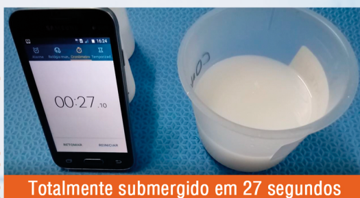
Totalmente submerso em 27 segundos