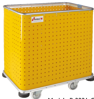
Modelo R-222 I-C