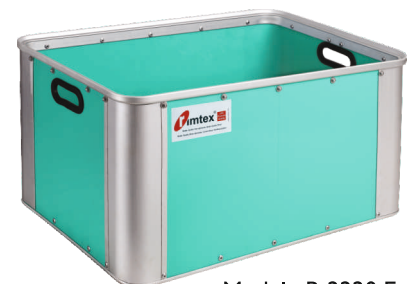
Modelo R-2220 E - Super forte