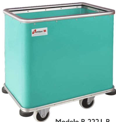
Modelo R-222 I-B