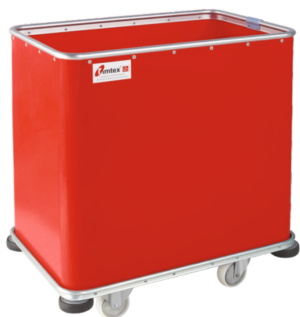
Modelo R-222 I-A

Especificação técnica: Carrinho multifuncional HDPE, sem pantógrafo, perfurado, com roda angular de segurança.