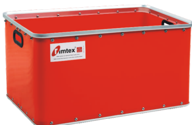
Modelo R-2220 A - Serviços Leves [ Desenho Registrado ("D") ]