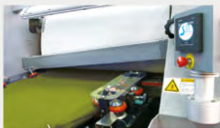
Sistema de Abertura de Largura de Tecido Magnético