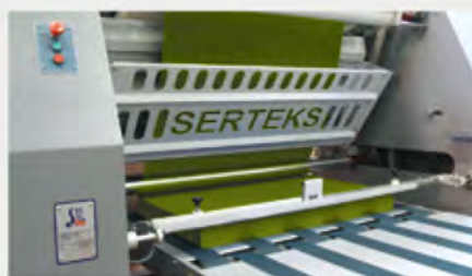
Unidade de Dobra de Tecido com Precisão