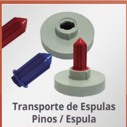
Transporte de Espulas Pinos / Espula