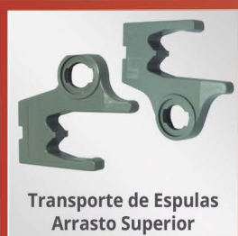
Transporte de Espulas Arrasto Superior