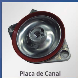
Placa de Canal