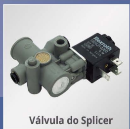
Válvula do Splicer