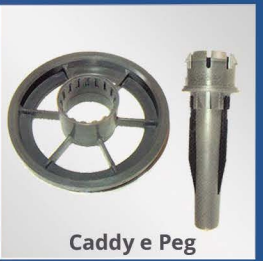
Caddy e Peg