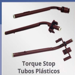
Torque Stop Tubos Plásticos