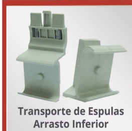
Transporte de Espulas Arrasto Inferior