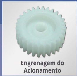
Engrenagem do Acionamento