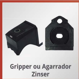
Gripper ou Agarrador Zinser