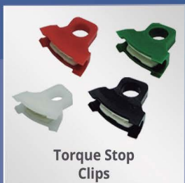
Torque Stop Clips