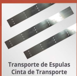
Transporte de Espulas Cinta de Transporte