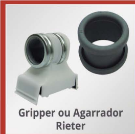
Gripper ou Agarrador Rieter