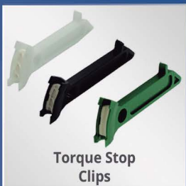
Torque Stop Clips