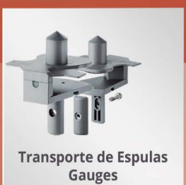
Transporte de Espulas Gauges