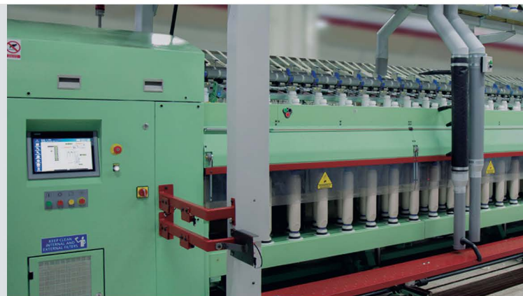
FT60: Bitola 110 mm | bobina de 6"x16" FT70: Bitola 130 mm | bobina de 7"x16"